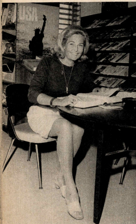
Em seu escritório no Consulado americano, ela trata das trocas comerciais entre Brasil e EUA.

“T ENHO espírito de cigana. No fundo, sou uma aventureira. Talvez por isso me sinta atraída por esse tipo de vida sem parada certa, vivendo em lugares os mais diversos e entre povos os mais diferentes, e descobrindo que, na verdade, todos procuram a mesma coisa e têm os mesmos anseios.”